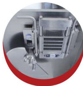
Vysoce kvalitní katry Cutting accessories of high-quality