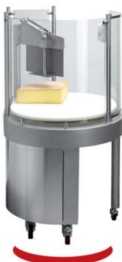
Vypouklé ochranné sklo With option convex windows