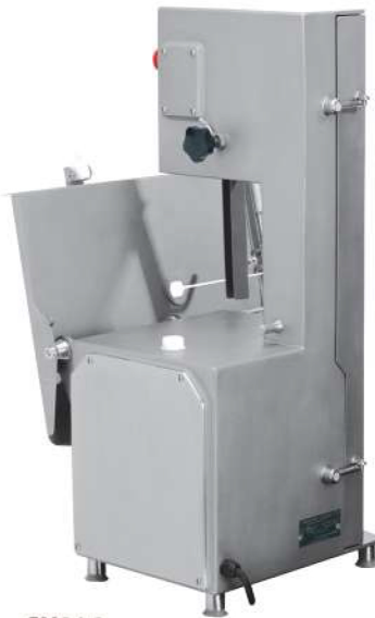
SX220 Silikonové těsnění zadního krytu Silicone water tight joint on back door