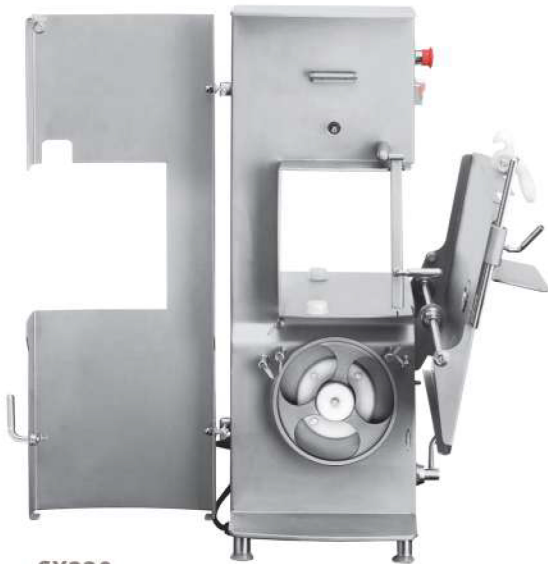
SX220 Pozice pro čištění - sklopný stůl Cleaning position - Tip table