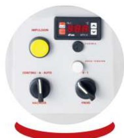
Ovládací panel Control panel

Mechanical parts of great quality + tightness ring