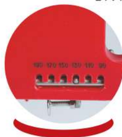
Automatické dávkování od 90 po 180 gramů Automatic caliber from 90 to 180 grams