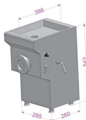
Rozměry TX82 Dimensions TX82