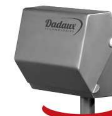
Ochranný kryt Screen protection against the water