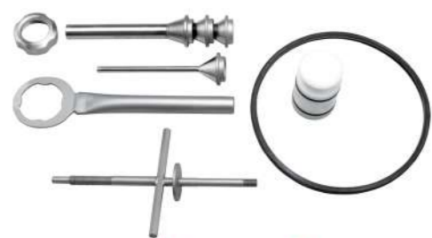
Příslušenství z nerezové oceli Accessories in stainless steel 18/10