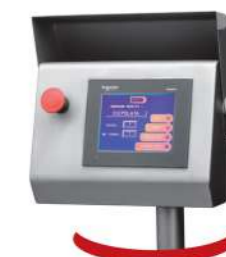
Dotykový panel s jednoduchým programováním Tactile screen simple and pleasant programming