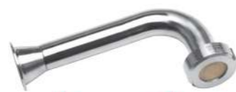
Příplatková výbava Zahnutá trubice se zpětnou kladkou pro plnění do sklenic, krabic apod... Available option Bend nozzles with antidrop valve