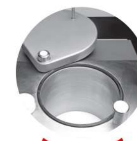
Písnice 32 L 32 Litres cylinder